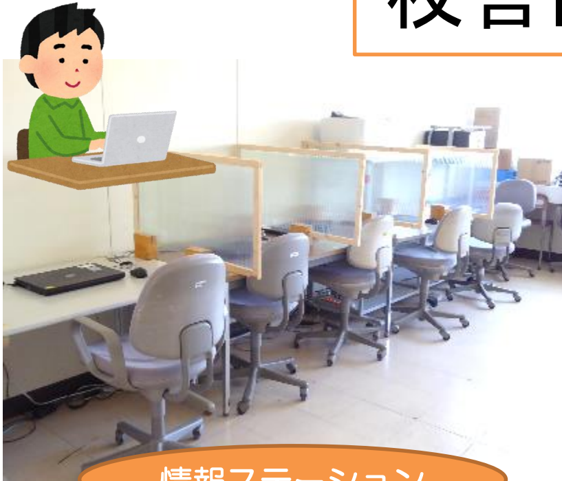
情報ステーション